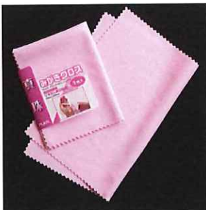
■真珠みがきクロス 1枚入り 関連カテゴリ

用途 : GOLD/SILVER磨き カラー : イエロー/ブルー 寸法 : 125×195mm 素材 : 超極細繊維 サイズ : 125mm×195mm 店頭価格(税別) 430円