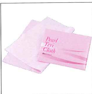
■真珠テリクロス 1枚入り

用途 : プラチナ磨き 素材 : 極細繊維、超微粒子研磨材、ワックス、高級脂肪酸 カラー : ピンク 寸法 125×195mm 店頭価格(税別) 250円