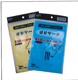
■ポリマール(125mm×195mm) 1枚入り イエロー/ブルー

ポリマールは超微粒子研磨剤とツヤ出し剤を含んだ研磨布です。貴金属製品の小さなキズの除去やツヤ出しに使用します。イエローは金向き、ブルーは主に銀製品向きです。 ※研磨剤を含んでおりますので、メガネやカメラのレンズなどにはご使用できません。