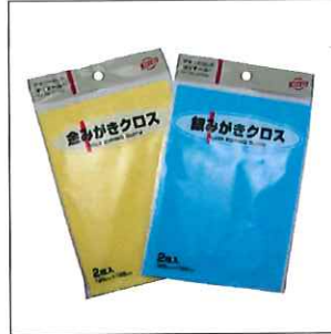
■銀みがきクロス(125mm×195mm) 2枚入り イエロー/ブルー

用途 : GOLD/SILVER磨き カラー : イエロー/ブルー 寸法 : 125×195mm 素材 : 超極細繊維 (ポリエチレン45%、ナイロン35%) サイズ : 125mm×195mm 店頭価格(税別) 220円