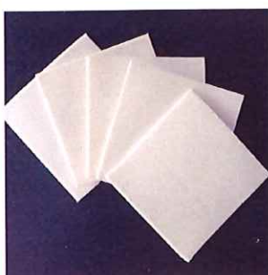
■プロポリッシュ磨きクロス 20枚入

用途:ジュエリー地金、宝石のクリーニング サイズ:20cmX20cmです。 店頭価格(税込) 550円