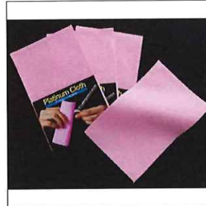
■プラチナクロス 1枚入り

用途 : 真珠、サンゴ、ヒスイ等のつや出し カラー : ピンク 寸法 : 125×195mm 素材 : 超極細繊維 (ポリエステル65%、ナイロン35%) 店頭価格(税別) 580円