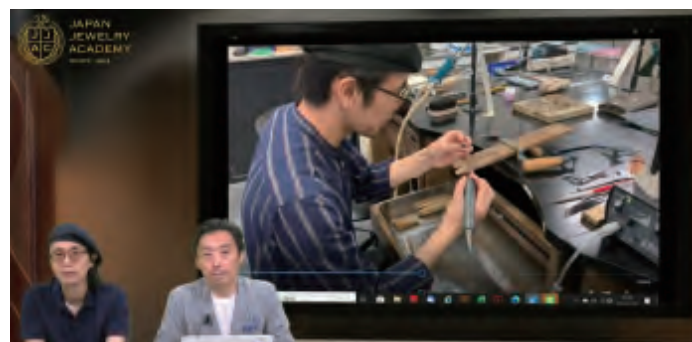
ジュエリーの産地山梨でジュエリーづくりを趣味からでもチャレンジ

ジュエリーを作ってみたい、まずは趣味でやってみたい、既にハンドメイドクラフトでアクセサリなどを販売しているがもっと差別化をしたい等々とお思いの方、この講座ではジュエリー制作法の代表的な制作技法であるロストワックスの技術を初心者の方でもすぐに始められるようにわかりやすく説明いたします。