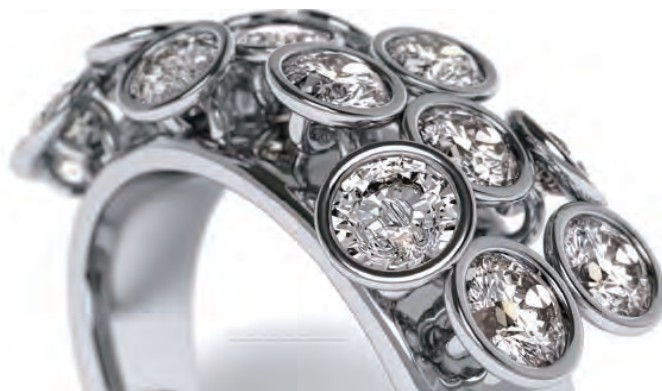
最新の CAD では写真のようにジュエリーの魅力をつたえることができます

ジュエリーウィークでは製造業者や学生様に向けた設計製造編と販売、リフォーム、プレゼンテーション等の営業編に分け業者の方だけでなく一般の皆様においてもこれからどのようなかたちで CAD というものが皆様に関わってくるのか、最新のジュエリー専用 CAD を使ってどなたでもわかりやすくその魅力をご紹介します