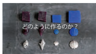
どのように作るのか？