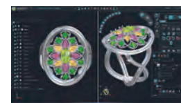
優れた 3 DESIGN CAD の機能を習得することで生産性の向上に繋がります